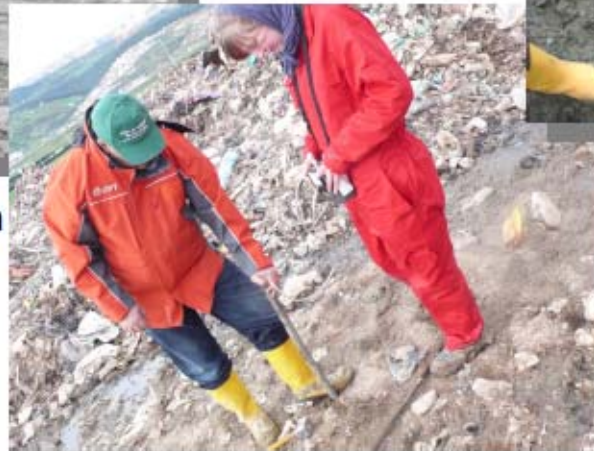
Probenahmestellenuntersuchung mit dem Dräger