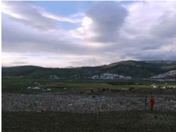
Draufsicht auf die Deponie