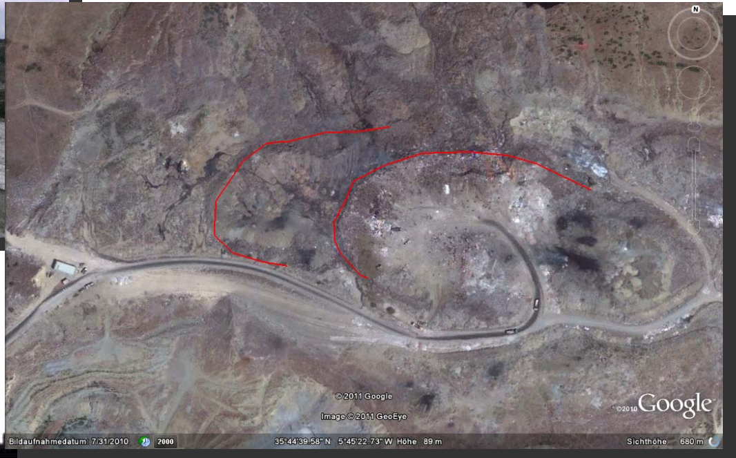
Draufsicht auf die Deponie