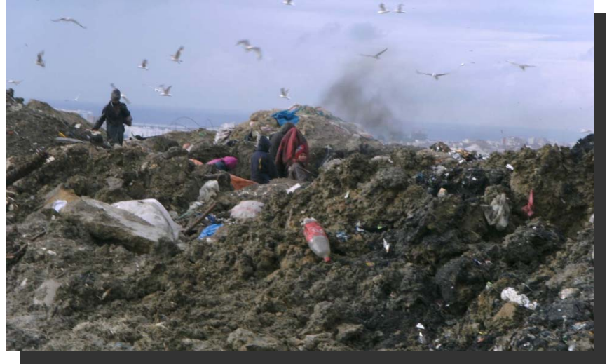
Kinder verbrennen Elektroschrott