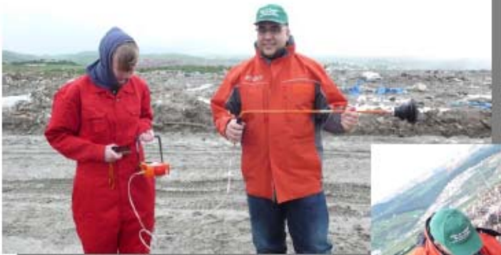
FID Begehung mit dem Sewerin