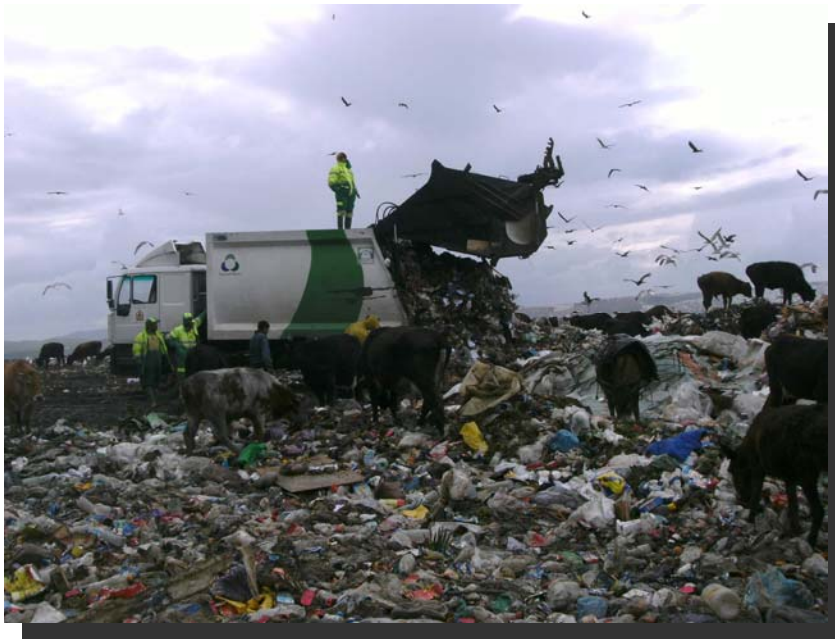
Arbeiten auf der Deponie