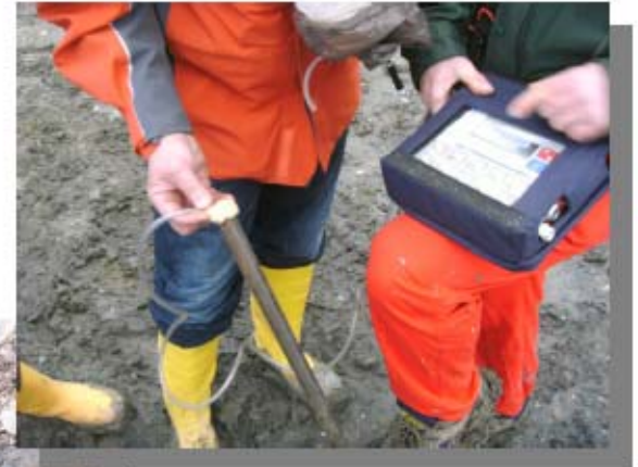
Probenahme mit dem GA 45