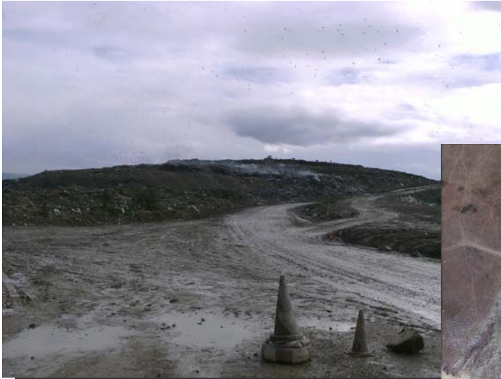
Auffahrt zur Deponie