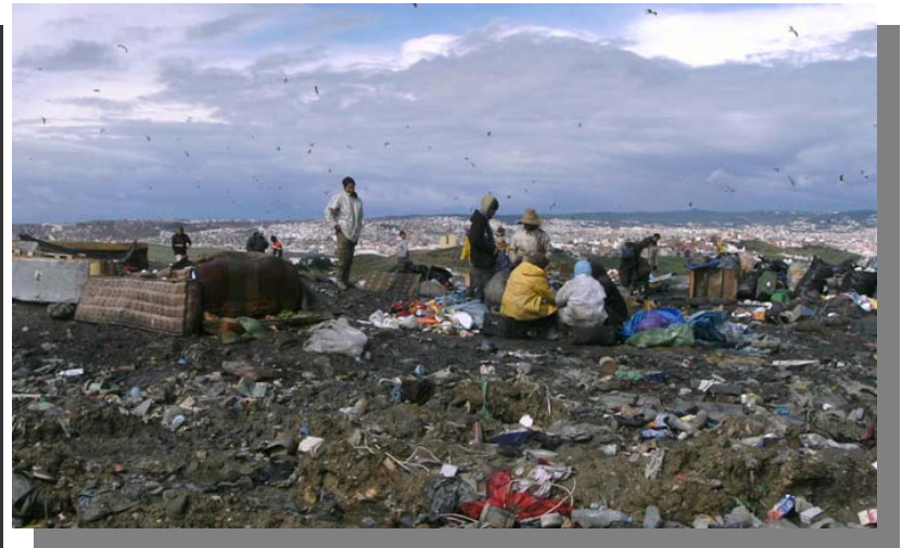
Leben auf der Deponie