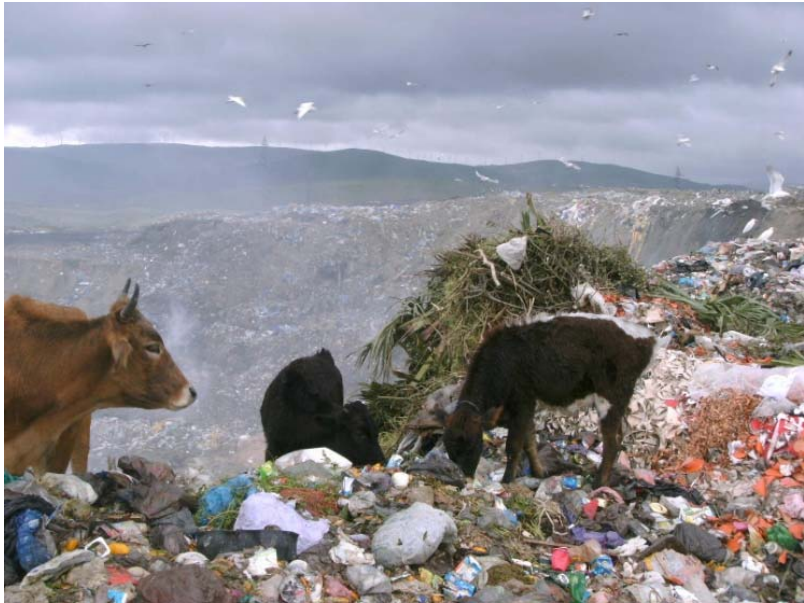
Weidetiere auf der Deponie